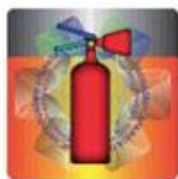
Slika 5. Izgled holograma u prirodnoj veličini